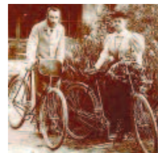
Marie et Pierre Curie

En juin 1903, Marie Curie soutient sa thèse d'état. À la fin de cette même année, Marie et Pierre Curie, ainsi qu'Henri Becquerel se voient décerner le Prix Nobel de physique pour leur découverte de la radioactivité naturelle et pour leurs études des phénomènes de rayonnement. En 1911, le jury des Prix Nobel décide de décerner un second prix (c'est un cas unique), celui de chimie cette fois, pour la découverte des éléments radium et polonium, la séparation du radium et l'étude de cet élément remarquable.